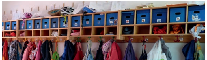
Liebevolle Betreuung für Kinder von Uniangehörigen: Das Betreuungsangebot an der Goethe-Universität ist in den vergangenen Jahren stark gewachsen.

Drei Kindertagesstätten trägt die Universität selbst: die Campus-Kita Westend mit 78 Betreuungsplätzen sowie die Kita Zauberberg (30 Plätze) und die Groß-Kita Kairos mit 135 Plätzen, beide am Riedberg. Einige Plätze der Kita Kairos werden vom Max-Planck-Institut für Hirnforschung belegt. Wegen des Erzieherinnenmangels kann die Kapazität hier aber noch nicht voll ausgeschöpft werden. 75 Prozent der Plätze in betriebsnahen Kitas werden selbstverwaltet an Beschäftigte vergeben. Um die restlichen 25 Prozent können sich Studierende mit Kindern bei der zentralen Stelle der Stadt bewerben und werden bevorzugt berücksichtigt. Darüber hinaus gibt es die Krabbelstube Universum in