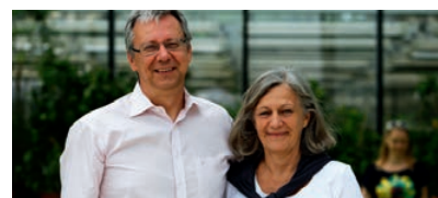
Neue Serie: Liebesgeschichten aus der Uni

Für Schulklassen, meist ab Jahrgangsstufe fünf, geben die unterschiedlichen Fachbereiche in Form von Schülerlaboren Einblicke in die Tätigkeit eines Wissenschaftlers – häufig die eines Naturwissenschaftlers. Drei verschiedene Angebote gibt es zum Beispiel im Fachbereich Chemie: Im Schülerlabor Chemie können sich Schülerinnen und Schüler im Rahmen der Thementage Chemie mit unterschiedlichen Bereichen der Chemie ausein-