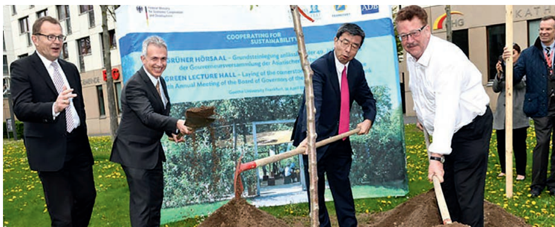
Spatenstich für den Grünen Lesesaal, auf den sich die Studierenden schon jetzt freuen dürfen.