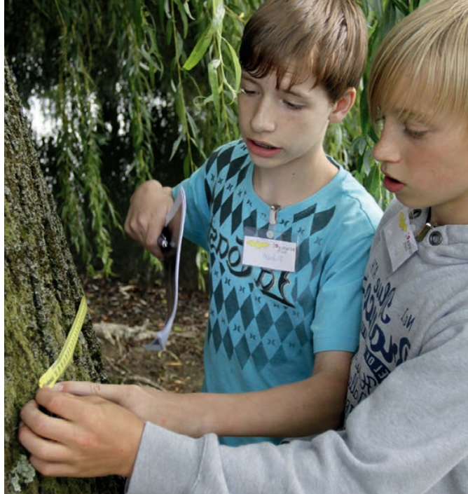
Selbst in die Natur gehen und forschen, das können Schüler zum Beispiel bei den ScienceTours der Goethe-Universität.