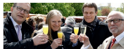
Neuer Markt: Campus Westend wird immer lebendiger