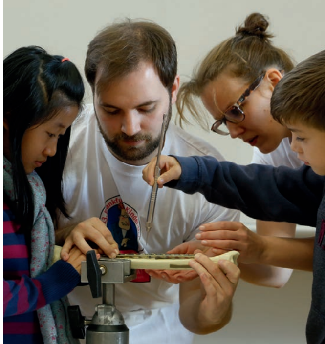
Wie ein verletzter Knochen mit einer Metallplatte verstärkt wird, das erleben die Schülerstudenten voriges Jahr bei der Kinderuni-Vorlesung der Orthopädie.